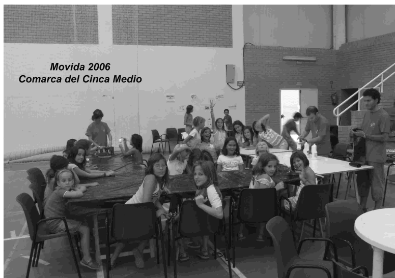
Un año más y durante la segunda semana de agosto, llegó la "Movida" organizada por la Comarca del Cinca Medio. Organizando juegos para los más jóvenes en el pabellon polideportivo "Pepe Chaverri".