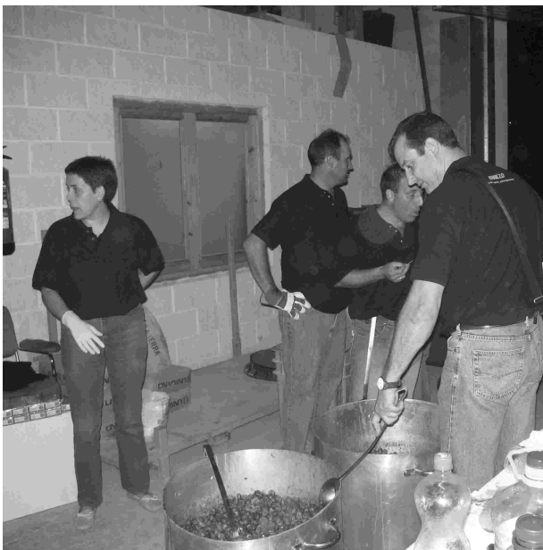
La suerte esta echada, los caracoles son repartidos en los remolques para su distribución. La gente esperaba en la entrada de las escuelas y se abalanzó en orden hasta los encargados de repartir los caracoles, agotándose las existencias. Estaban muy buenos ¡felicidades!.