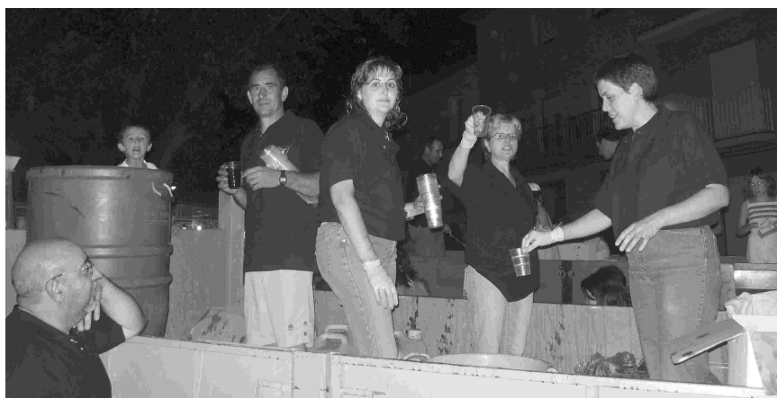
El pan y el vino, complementos de los caracoles, se sirvieron en otro remolque.