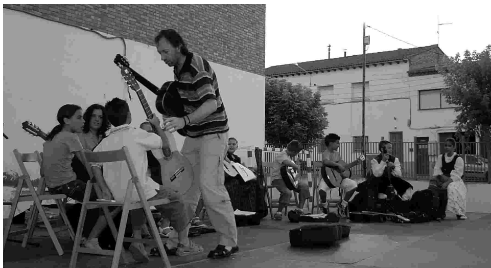
El 30 de junio se hizo la fiesta final de curso de la Rondalla.

El grupo de baile de mayores cada vez tiene más componentes, ¡ánimo!