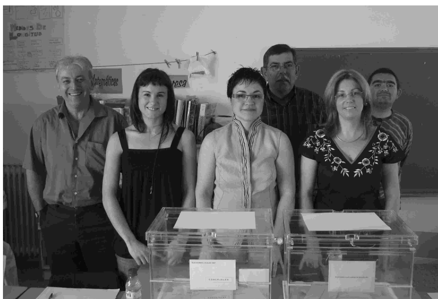
Mesa B. Las integrantes de la mesa junto a los interventores.