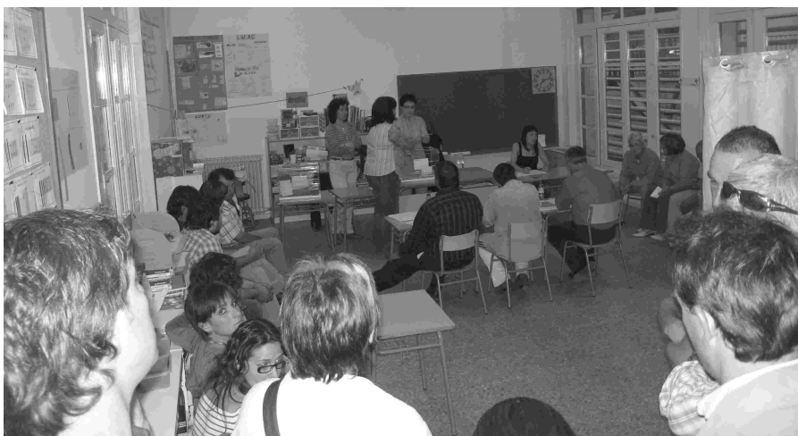
Elecciones municipales y autonómicas 2007