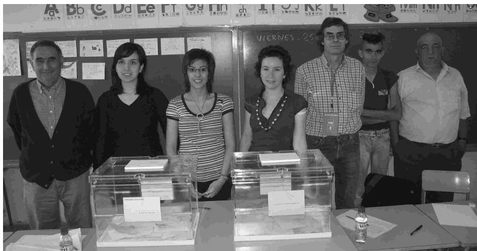
Mesa A. Las integrantes de la mesa junto a los interventores.

El pasado 27 de mayo, se celebraron elecciones municipales y autonómicas. Había censadas 1.278 personas con derecho a voto. En la mesa A, 640 (apellidos de la A-G) y en la mesa B, 638 (apellidos H-Z). Los resultados son que el PSOE obtiene 5 concejales, el PP, 2 y el PAR otros 2.