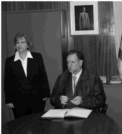
El Presidente del Gobierno de Aragón, D. Marcelino Iglesias visitó Binaced y Valcarca

La Rondalla de Binaced- Valcarca actuó en el homenaje a nuestros mayores que se celebró en las pasadas fiestas de San Marcos.