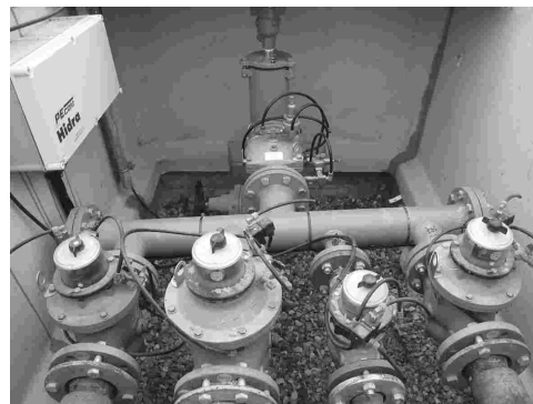
Hidrantes del pantano de la Sece

Habiendo dado nuestro más sincero apoyo y confianza a todos estos hombres que la mayoría de ellos con su tiempo y dedicación llevan tan difícil y buena gestión y a todos los que les precedieron cambiaremos a otras anécdotas que a pesar de oír las mucho, a veces cuesta interpretar, algunas de ellas son las siguientes: Toma: No es un toma de dar sino una toma de entrada de agua en las acequias principales. Boquera: Nos referimos a la Boca de entrada del agua procedente del río a la acequia. Brazal: rasilla, acequia son las conducciones a cielo abierto, o con tubos de hormigón o de plástico que llevan el agua hasta el mismo campo, es lo que mas abunda y en las de cielo abierto sale mucha hierba que antes se limpiaba con la jada el barro y la hierba con la segadera, el dallón o el falzón y ahora con excavadora o también pidiendo un permiso de Extensión Agraria puedes apretar un misto y ¡Hala! brazal limpio. Canal: En 1.914 se llamó Acequia de Zaidín a lo que hoy conocemos como el Canal de Zaidín. Es una derivación del gran canal de Aragón y Cataluña procedente del Pantano de Barasona.